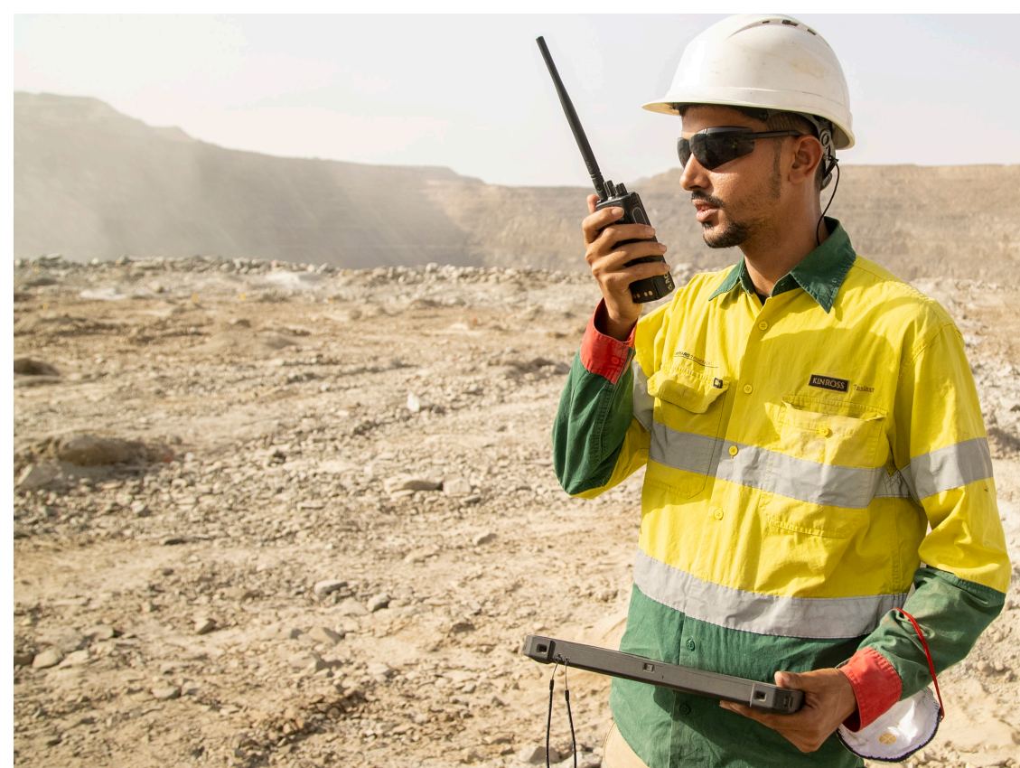
Sur le site de Tasiast, un employé dans une zone minière en activité.