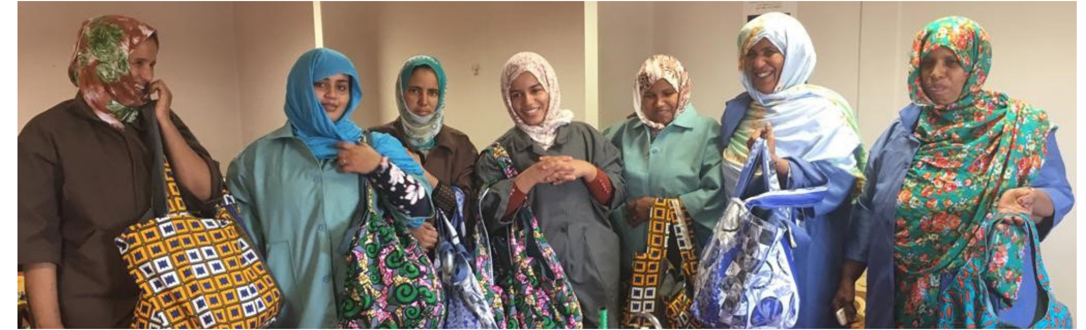
Membres de la Coopérative des femmes de Tasiast.

Droite : Partenariat à long terme de Kinross Tasiast avec Project C.U.R.E. et le ministère mauritanien de la Santé en 2024. Kinross a fait don de 15 conteneurs de 40 pieds remplis de matériel médical et de fournitures médicales d'une valeur avoisinant les 6 millions de dollars, améliorant ainsi considérablement les systèmes de soins de santé en Mauritanie. Sur la photo, un membre de la communauté passe un examen de l'oreille lors du deuxième don de fournitures médicales essentielles.