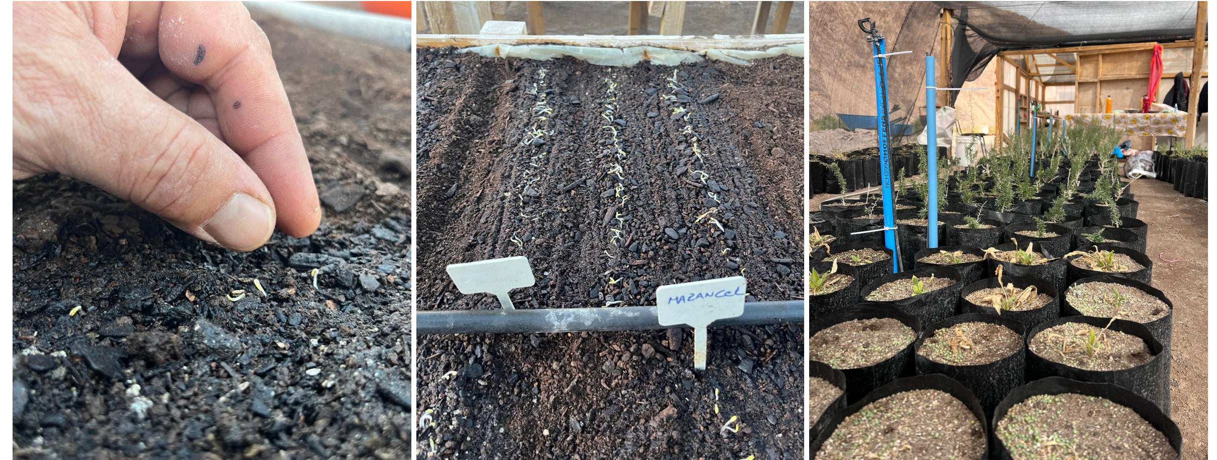
La Comunidad Indígena Colla de la Comuna de Copiapó prepara semillas para la siembra y plantación como parte del Proyecto Flora Nativa, dentro del marco de los Acuerdos Voluntarios para la Fase 7 de La Coipa.

referencia. La finalización del estudio y su presentación están previstas para la segunda mitad de 2025, y se presentarán a las autoridades chilenas como parte del proceso de obtención de permisos para ese proyecto.