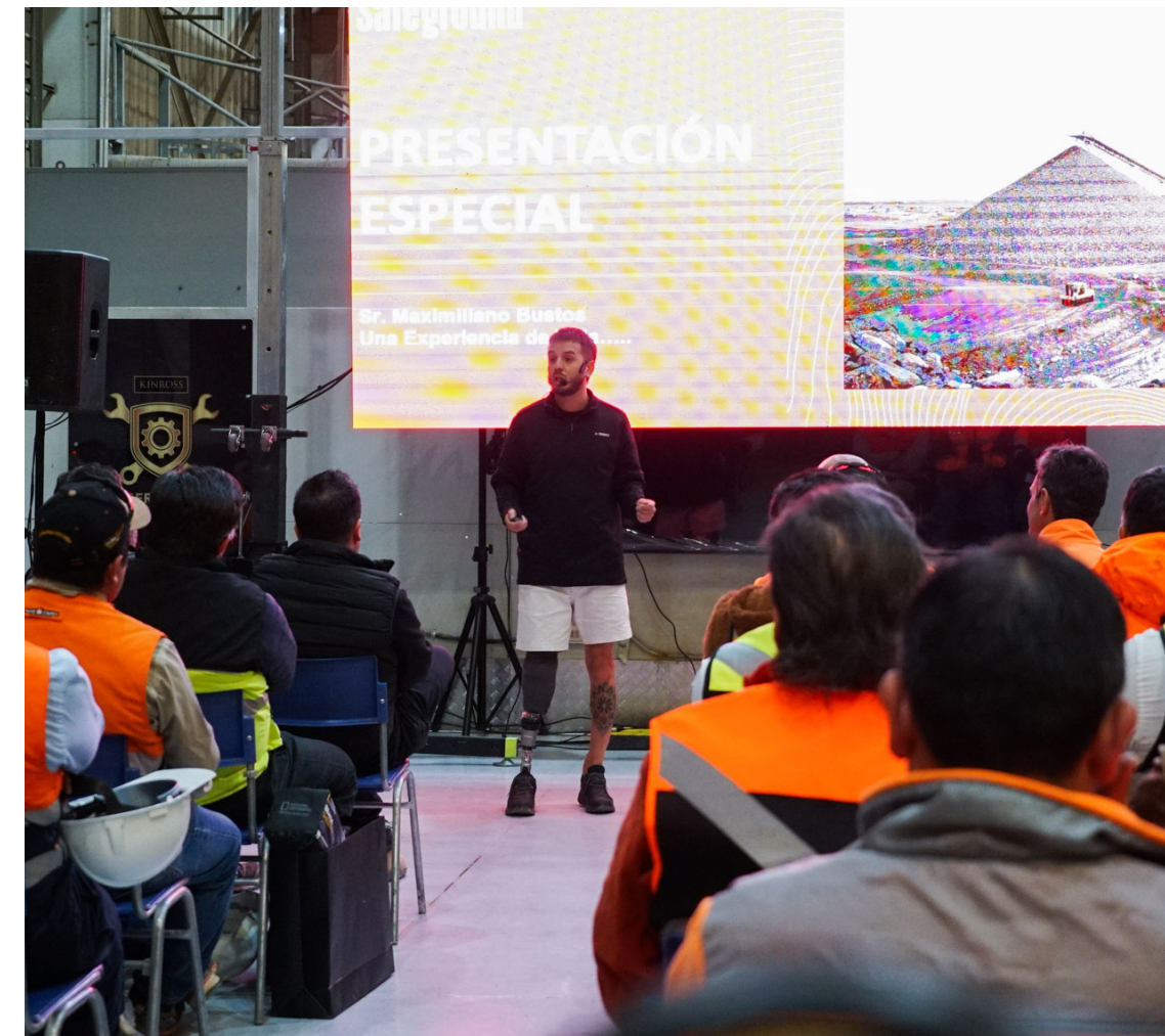
Arriba: En Chile, el lanzamiento de Safeground incluyó una presentación especial a los participantes.

Dado que La Coipa es un sitio remoto, ubicado a gran altitud, los servicios médicos del sitio son prestados por médicos y enfermeras ubicados en el sitio. Después de una evaluación médica de los principales sitios de Kinross, se tomaron medidas para realizar mejoras adicionales en los equipos médicos de los sitios.