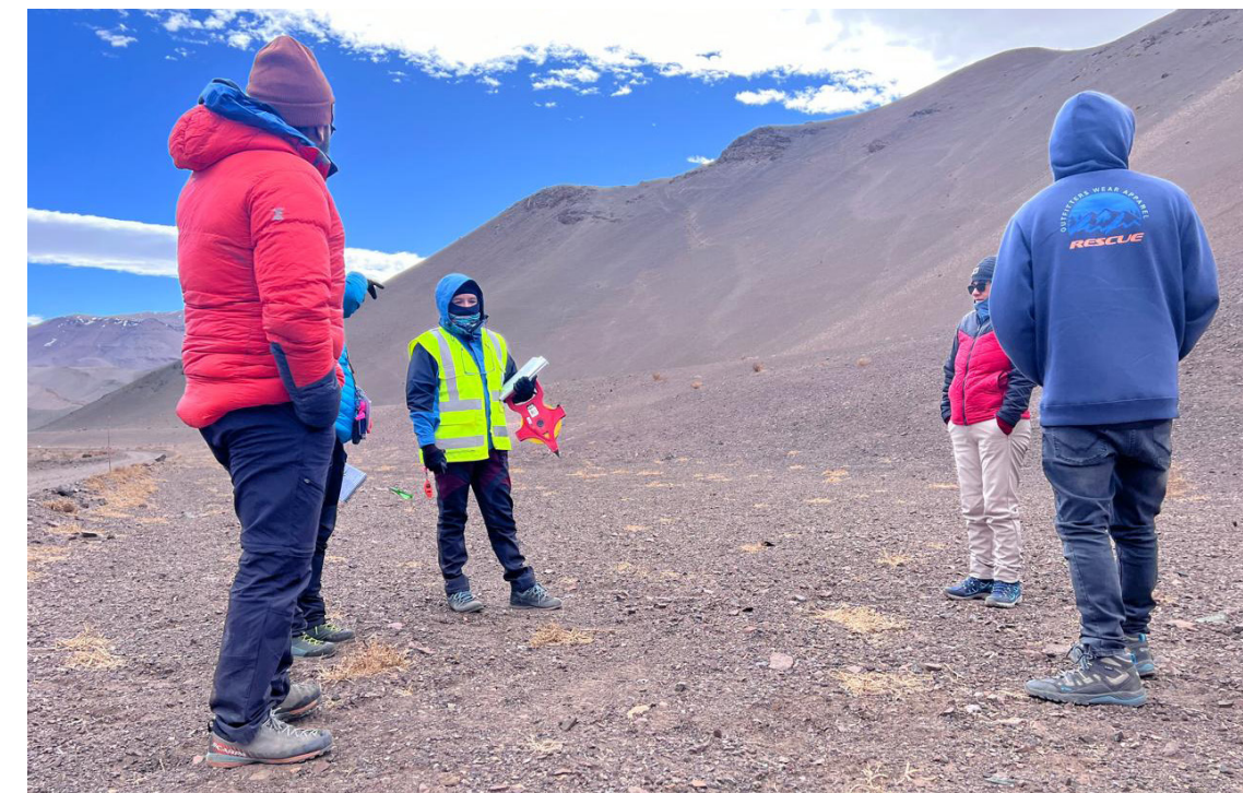
Las Comunidades Indígenas de Pastos Grandes, Comuna de Copiapó y Sol Naciente participan en la actualización de la evaluación ambiental de referencia en Lobo-Marte.

referencia. La finalización del estudio y su presentación están previstas para la segunda mitad de 2025, y se presentarán a las autoridades chilenas como parte del proceso de obtención de permisos para ese proyecto.